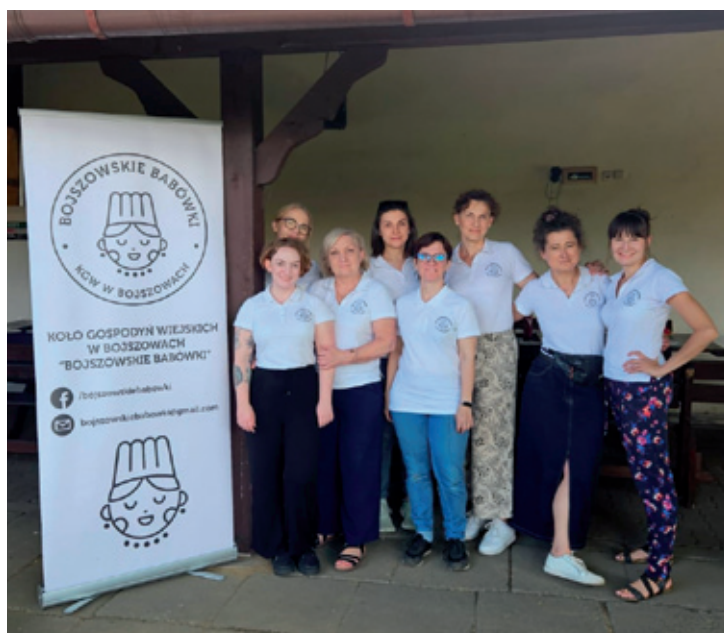
fol. JGW Bojszowskie Babówki