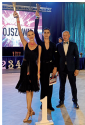
fot. U. Pomietto