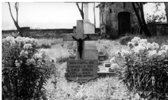
Zdjęcie archiwalne mogiły żołnierskiej na cmentarzu w Bojszowach

Projekt: Międzyrzecze, ratujemy śląskie historie