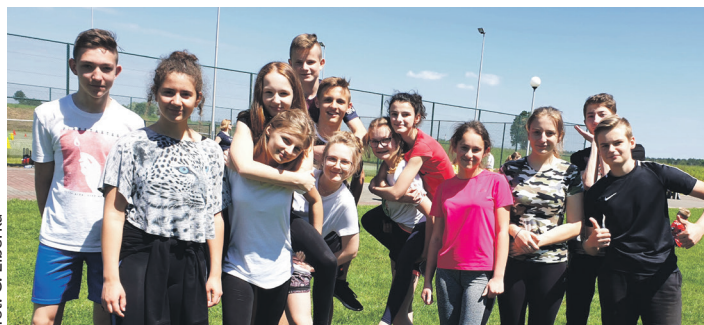
fol. C. Liberka