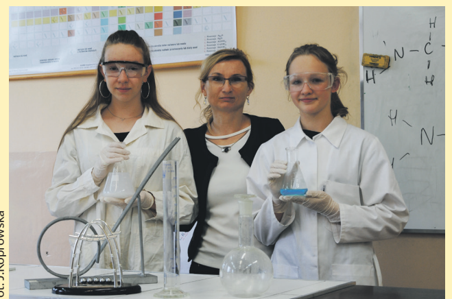
fol. J. Koprowska