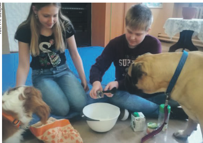
fol. M. Szoida