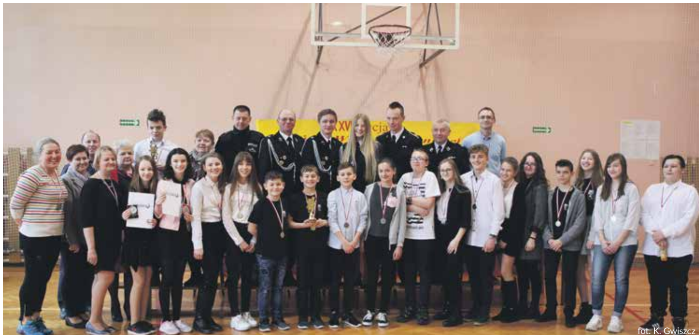
fol. K. Gwiszcz

Dzieci i młodzież ze Świerczyńca zdominowały gminną edycję Ogólnopolskiego Turnieju Wiedzy Pożarniczej „Młodzież zapobiega pożarom”. Uczciwie trzeba jednak wspomnieć o pierwszym miejscu reprezentanta Międzyrzecza.