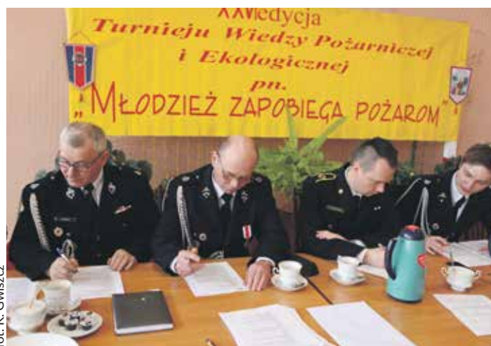
fol. K. Gwiszcz

Każdy z finalistów mógł uzyskać maksymalnie 40 punktów. Pytania były jednak dość trudne, najlepszy w grupie młodszej uzyskał 27 punktów. W grupie starszej o kolejności zdecydowała dogrywka, bowiem dwo-